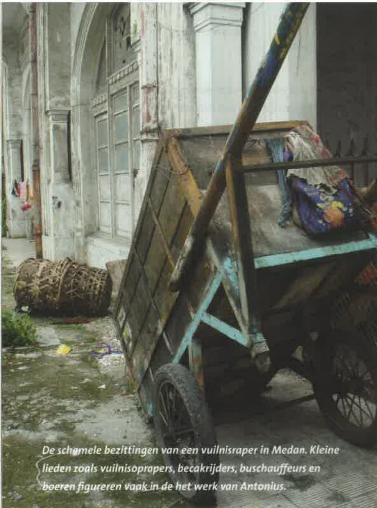
De schamele bezittingen van een vuilnisraper in Medan. Kleine lieden zoals vuilnisopapers, becakrijders, buschauffeurs en boeren figureren vaak in de het werk van Antonius.

Mijn vriend niet Wie van ons geeft u straks een hand En mag met u mee aanzitten aan het avondmaal?