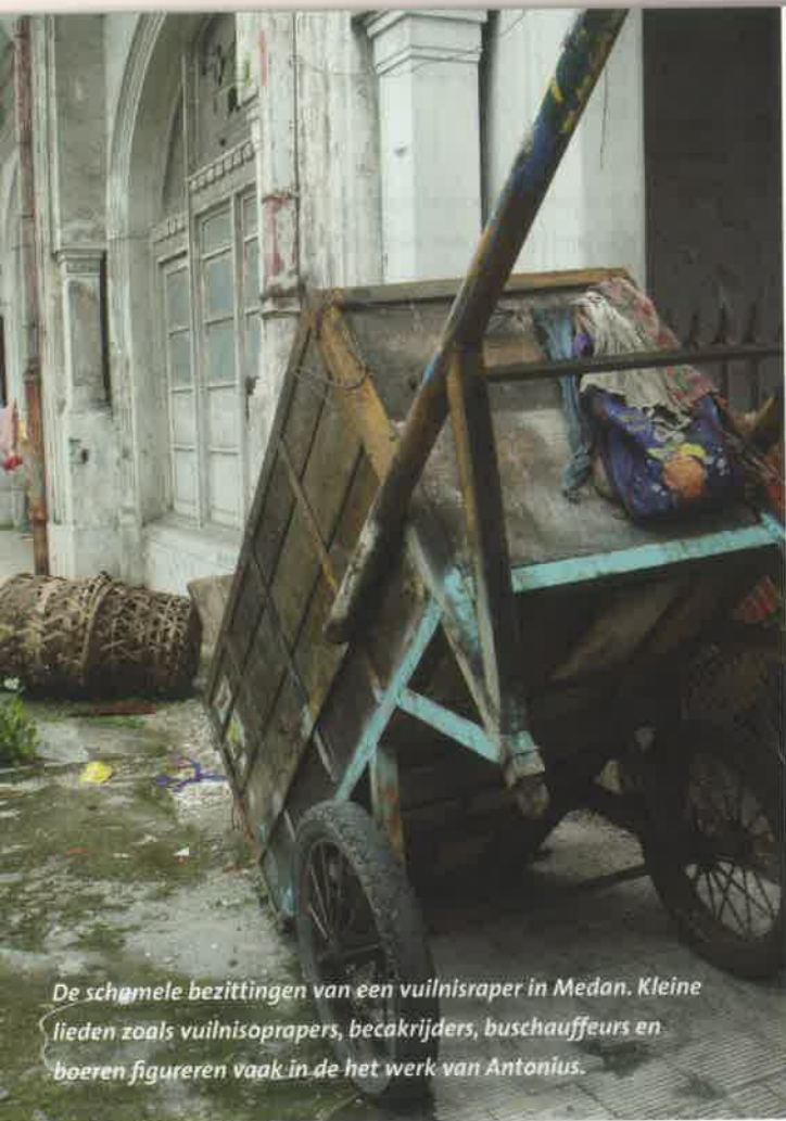
De schamele bezittingen van een vuilnisraper in Medan. Kleine liederen zoals vuilnisoprapers, becakrijders, buschauffeurs en boeren figureren vaak in de het werk van Antonius.

Mijn vriend niet Wie van ons geeft u straks een hand En mag met u mee aanzitten aan het avondmaal?